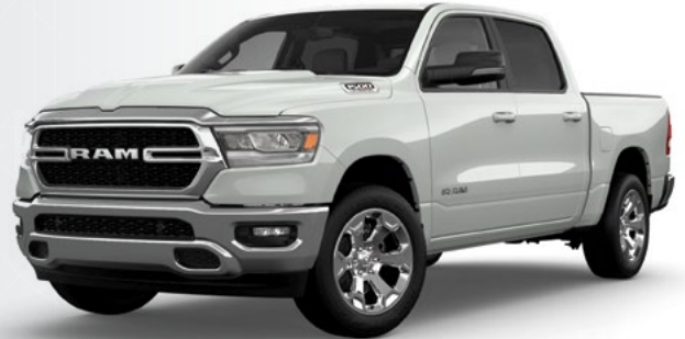
RAM 1500 (5 e génération) 2022 à 2019