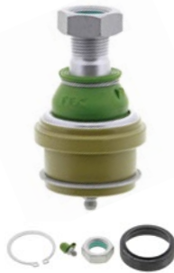
TXK8195T DODGE RAM 1500 ET 2500 1999 À 1994