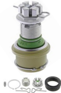
TXK3161T JEEP WRANGLER ET JEEP TJ 2006 À 1997