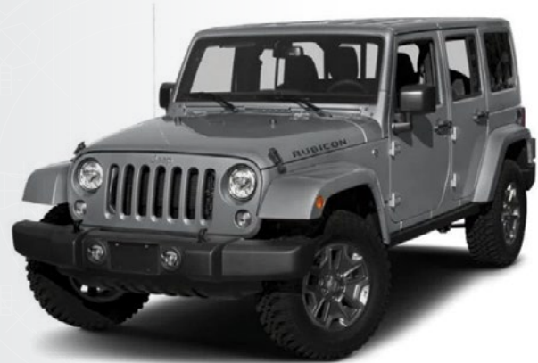
Jeep et Dodge RAM 2018 à 1984 avec essieux avant DANA 30 et 44