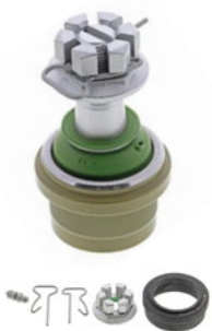
TXK3185 JEEP WRANGLER 2017 À 2007 ET WRANGLER JK 2018

Utilisez cette pièce avec les joints à rotule inférieurs avant TTX MD pour une solution de suspension technique!